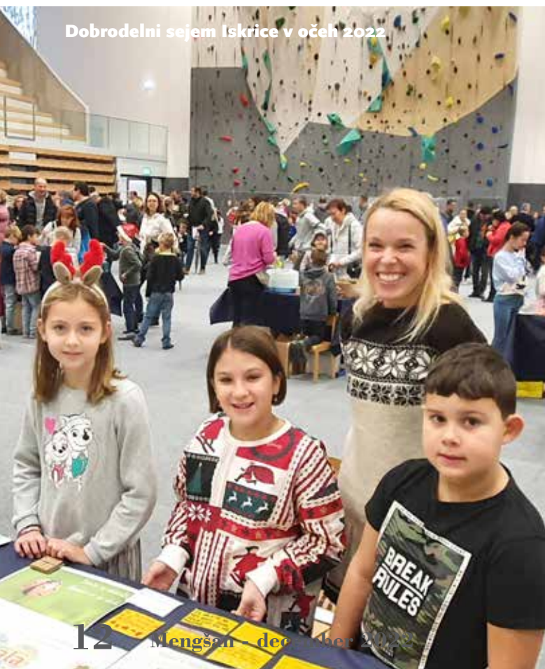
Dobrodelni sejem Iskrice v očeh 2022

Zelo težko bi le eno. Ustanovitev šolskega sklada namreč štejem za eno od najpomembnejših odločitev v času vodenja OŠ Mengeš. S tem naša šola daje zelo jasno sporočilo, da je poleg pridobivanja znanja njena temeljna vrednota tudi občutljivost