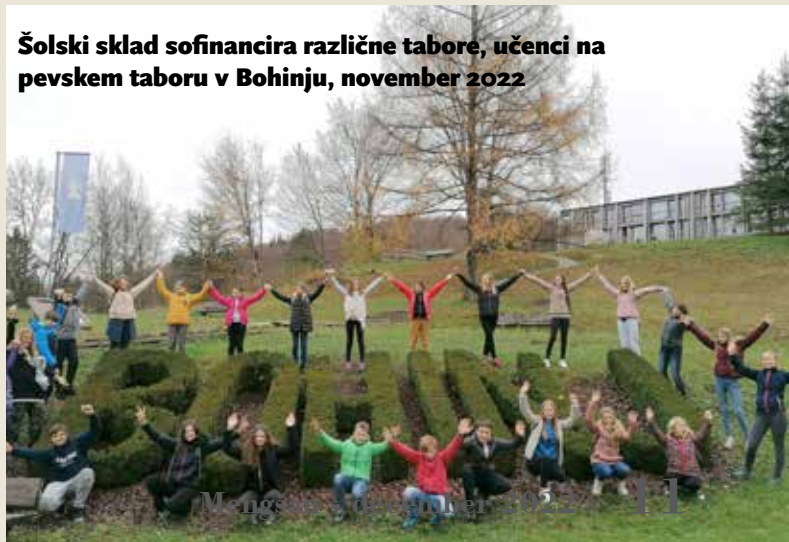
Šolski sklad sofinancira različne tabore, učenci na pevskem taboru v Bohinju, november 2022