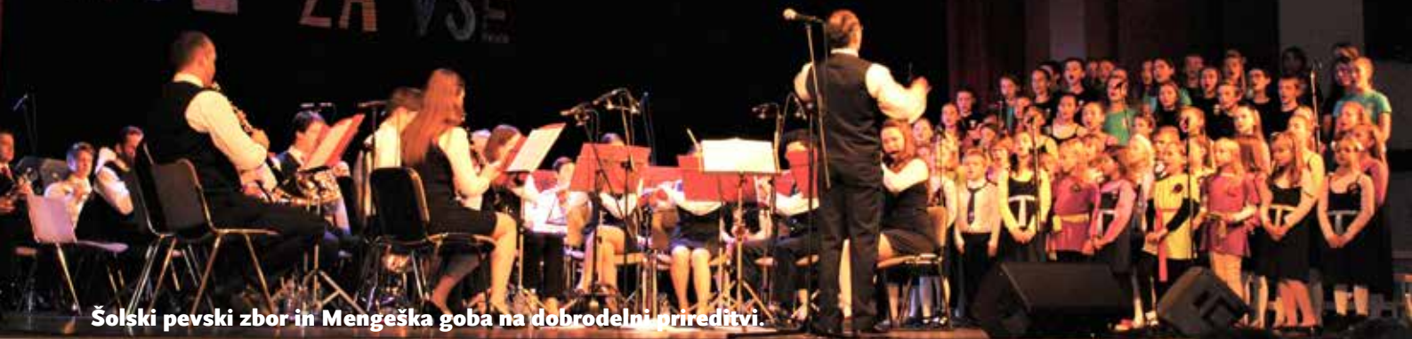
Šolski pevski zbor in Mengeška goba na dobrodelni prireditvi.